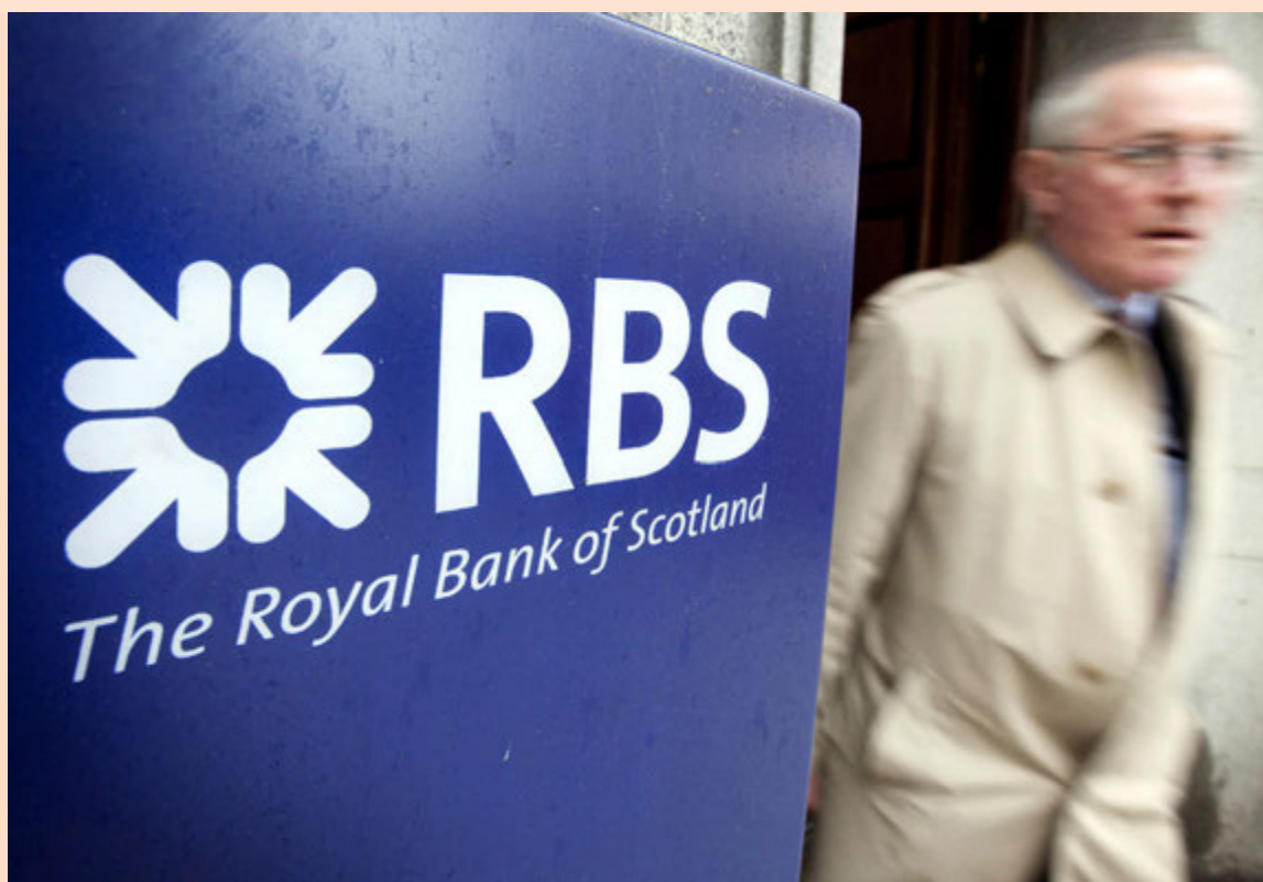
Þrjú hundruð störf flytjast til Indlands þar sem launakostnaður er mun lægri en í Bretlandi.