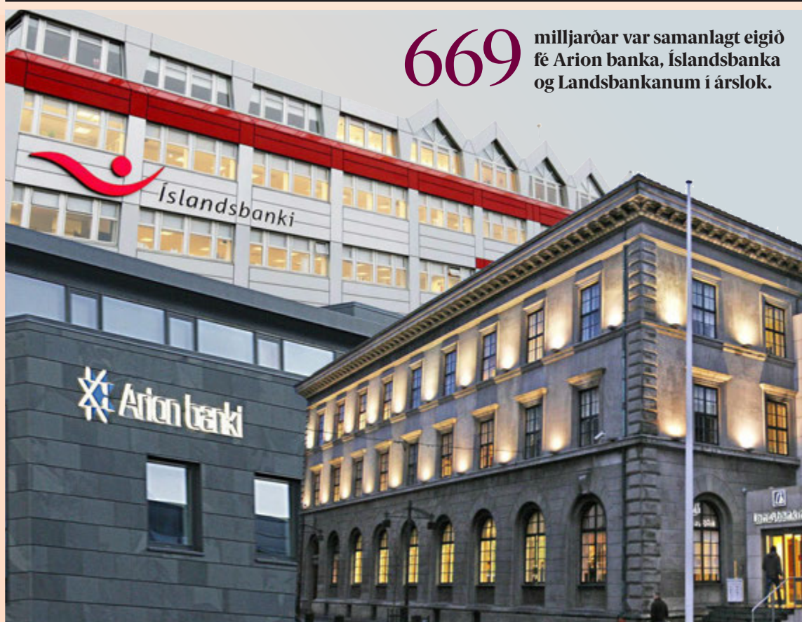
Hagnaður bankanna þriggja var 106,8 milljarðar á síðasta ári. Þetta er mesti hagnaður á einu ári frá hruni.

Netfang auglýsingadeildar auglysingar@markadurinn.is Veffang visir.is