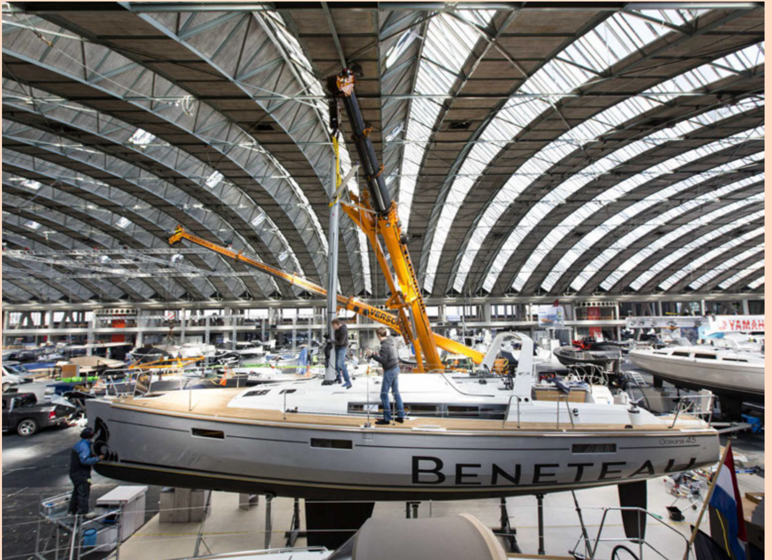
Bátasýningin í Amsterdam hefst í RAI ráðstefnuhöllinni í Amsterdam í dag. Á mánudag var unnið hörðum höndum við að undirbúa sýninguna. Sýningin, sem er stærsta sýning fyrir vatnaípróttir í Hollandi, stendur yfir frá 16. til 20. mars.