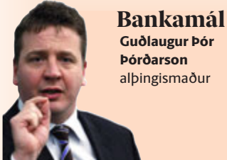
Bankamál Guðlaugur Þór Þórðarson alþingismaður