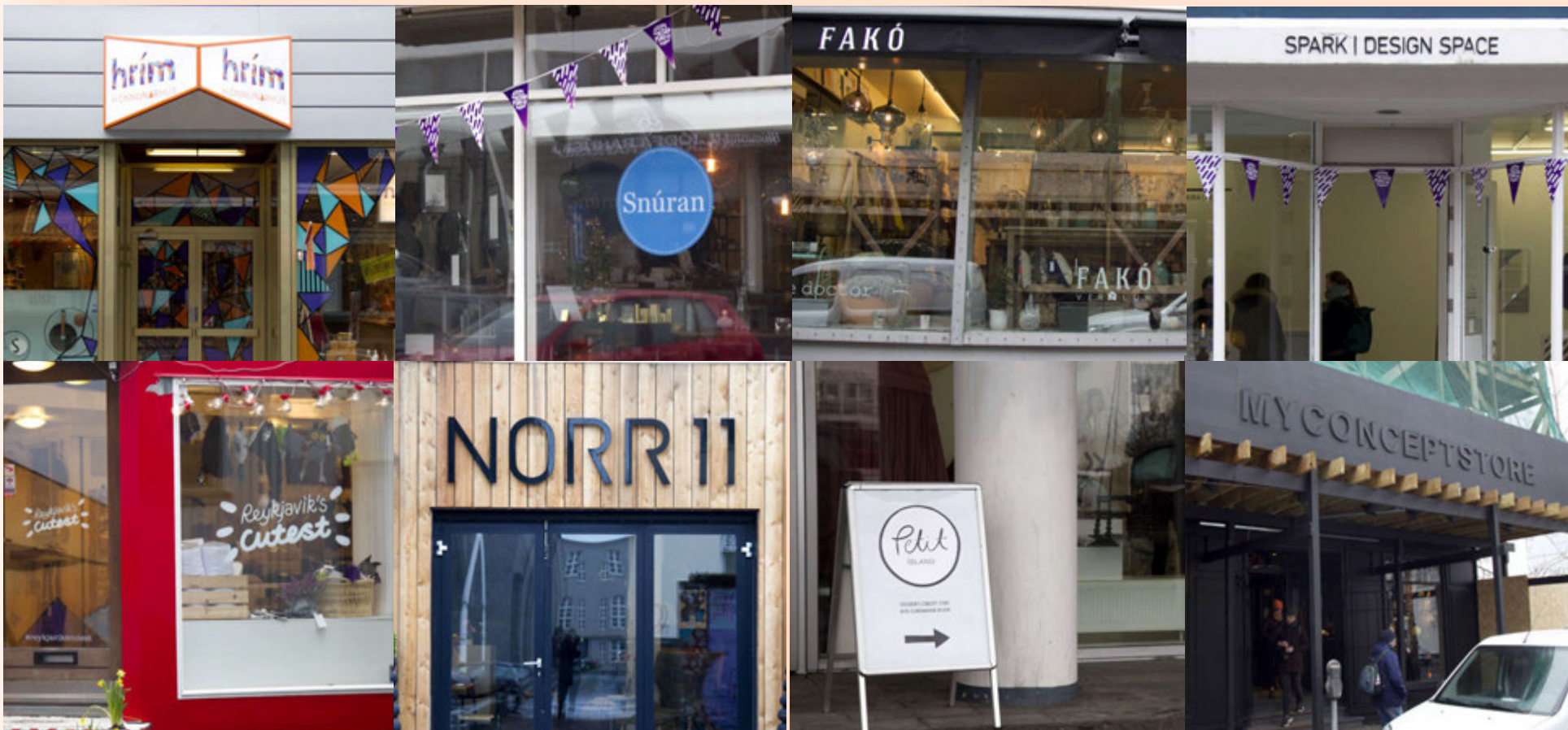
Hér má sjá brot þeirra verslana sem hafa verið opnaðar á síðustu fimm árum. Svokallaðar „lundabúðir“ sem selja hönnun að mestu til ferðamanna eru ekki með í talningunni.