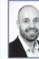
Eggert Maríuson Sölufulltrúi Sími 690 1472