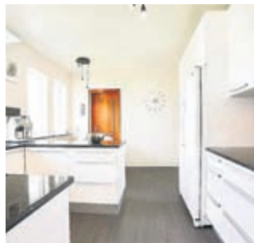
Eldhúsið var tekið í gegn árið 2007.

Skoðanir fasteigna og leiguíbúða. Verðmöt fasteigna. Þendo.is – 588 1200