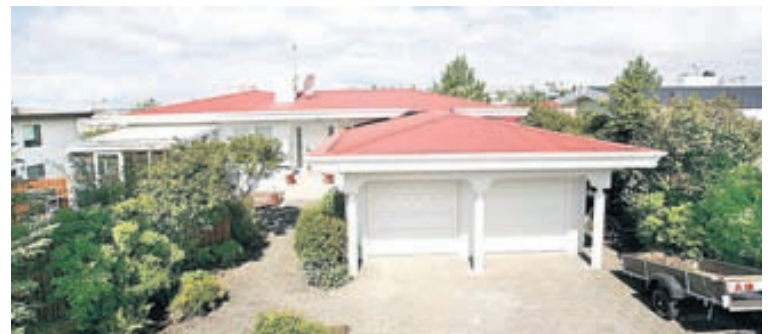
Húsið er samtals 344 fermetrar og skiptist í íbúð á efri hæð, bílskúr, sólstofu og íbúð á neðri hæð.