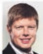
Ólafur Finnboðason sökufultrúi