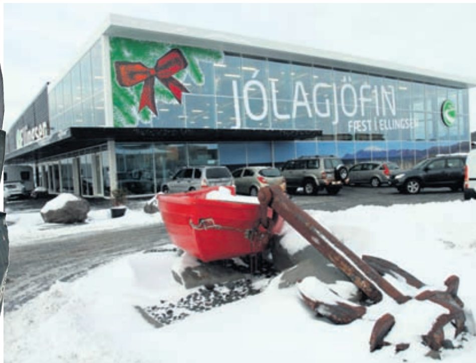
Ellingsen flutti í nýtt og stórglæsilegt framtíðarhúsnæði að Fiskislóð 1 árið 2006. Ellingsen er einnig með verslun á Akureyri og þjónustuverkstæði í Vatnagörðum.