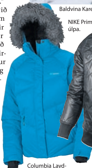
Columbia Layd-dúnúlpá í bláu.